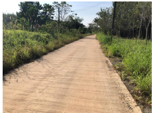
ซื้อวัสดุก่อสร้างถนน คสล. ซอยทรัพย์เจริญ หมู่ที่ ๑๑