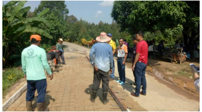
ซื้อวัสดุก่อสร้างถนน คสล. ซอยเจริญสุข หมู่ที่ ๓