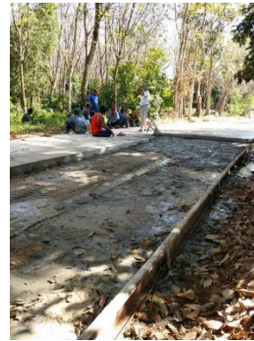
ซื้อวัสดุก่อสร้างถนน คสล. ถนนสายกลางหมู่บ้านลำอ่อน หมู่ที่ ๙