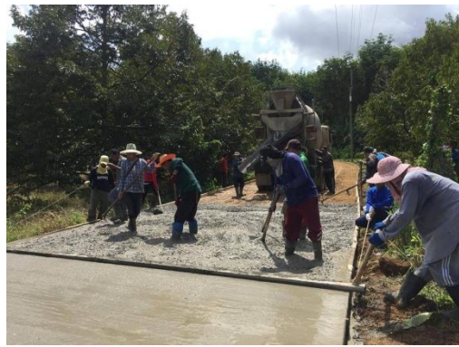
ซื้อวัสดุก่อสร้างถนน คสล. ซอยจันอุทิศ หมู่ที่ ๓