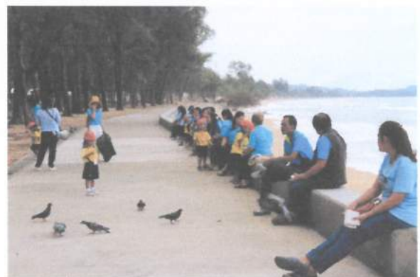
โครงการประชุมผู้ปกครองนักเรียน