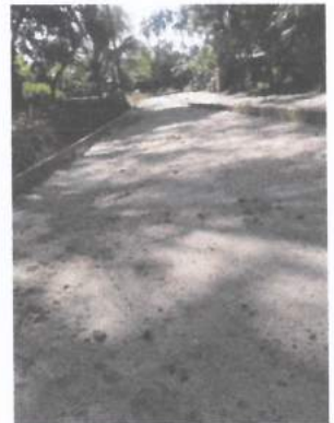
ก่อสร้างถนน คสล. ซอยสี่เสียด ๕ หมู่ที่ ๔