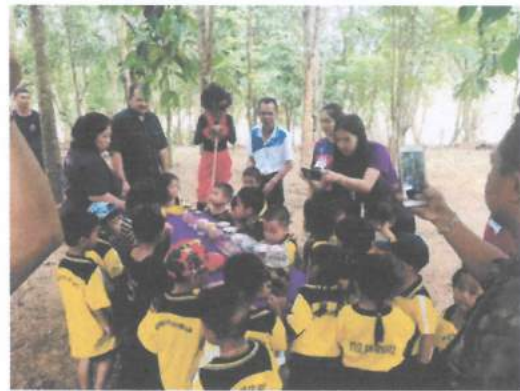
โครงการทัศนศึกษานอกสถานที่ (ได้รับเงินอุดหนุนจากกรมส่งเสริมการปกครองท้องถิ่น)