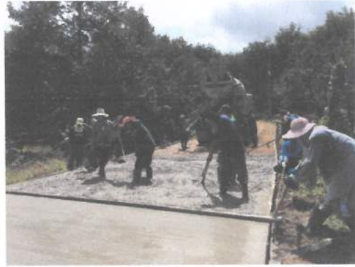
ก่อสร้างถนน คสล. ซอยทรัพย์เจริญ หมู่ที่ ๑๑